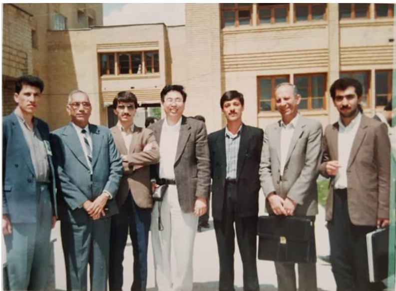
سال ۱۳۷۰، تربیت مدرس